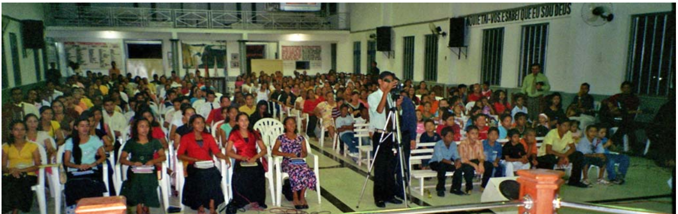
Adunare în Brazilia