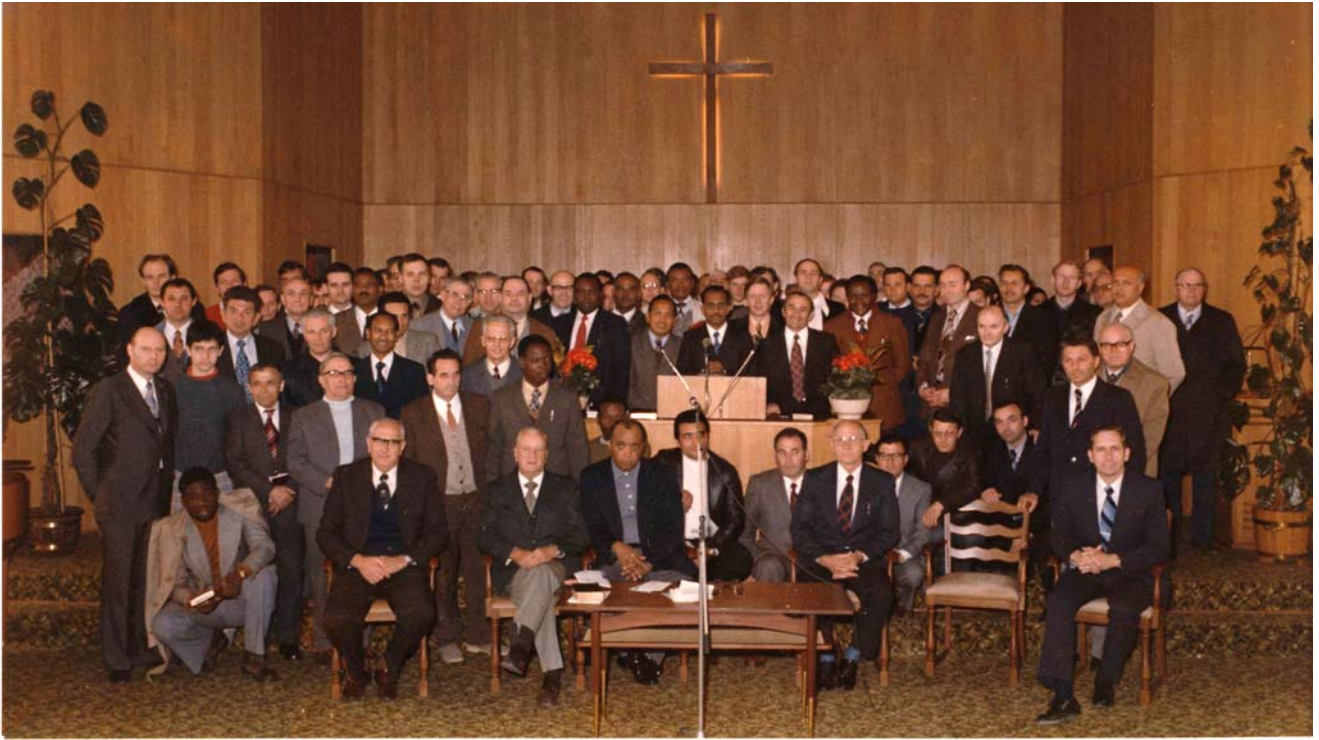
O fotografie de la o conferință cu frații slujitori, din aprilie 1976, la care au participat frați din 33 de țări

Având în vedere cei 50 de ani care au trecut, noi avem multe amintiri scumpe din adunări de pe întreg Pământul.