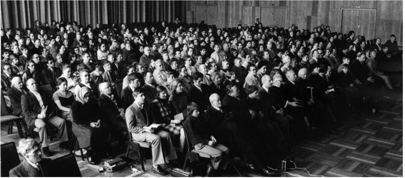
O adunare în Heilbronn, Germania, Paște – 1975