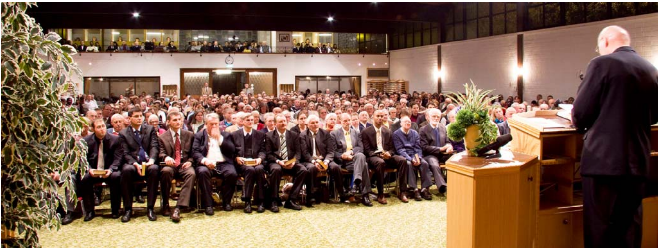
Adunare la Kreleld