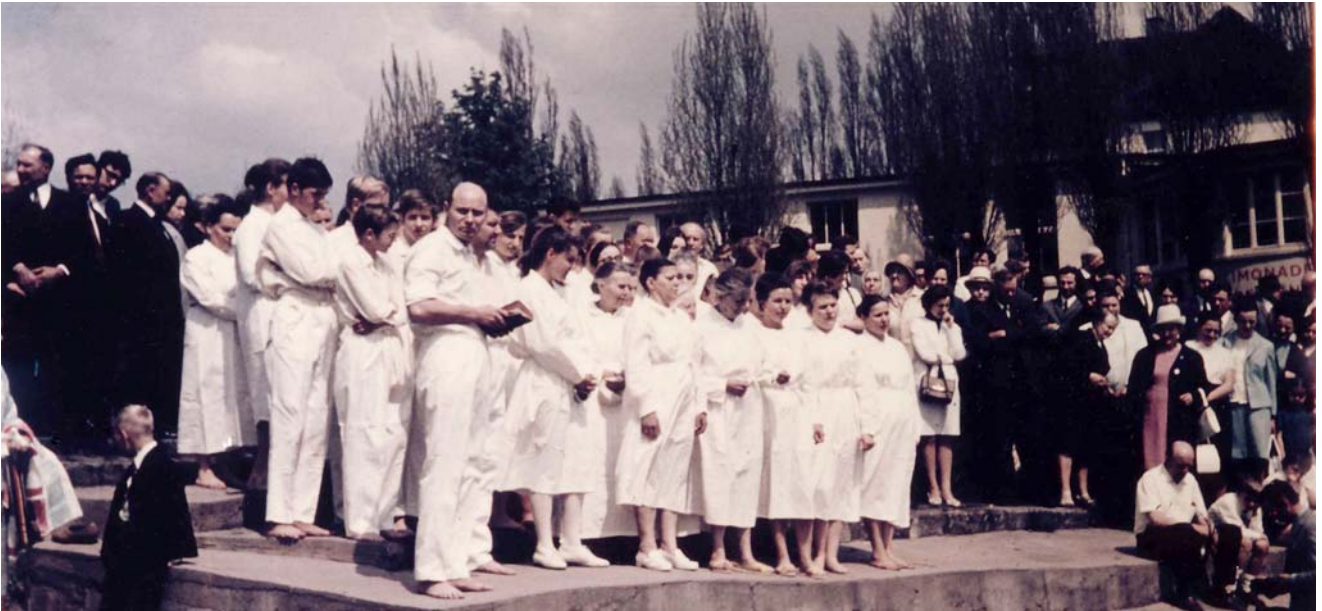
Din 1966 mii de frați și surori au fost botezați în Numele Domnului Isus Hristos