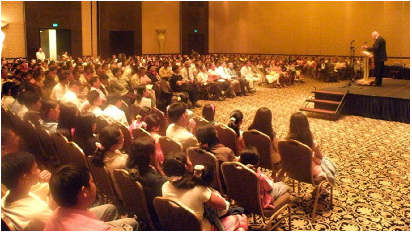
Adunare în Filipine