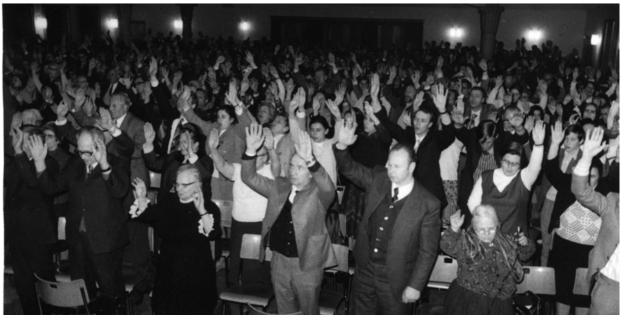
O adunare în Zürich, Elveția – Paște 1975